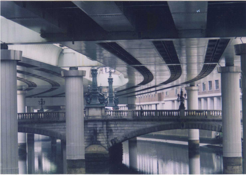
現日本橋上は高速道路。

お江戸日本橋から京は三條大橋まで 約四九ニキロ 慶長六年（一六〇一）徳川家康によつて 東海道に伝馬制が敷かれ街道が整備 された。これが東海道五十三次のけいまり である。