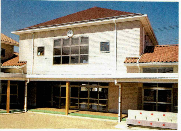
木造住宅に求められる外壁パネル