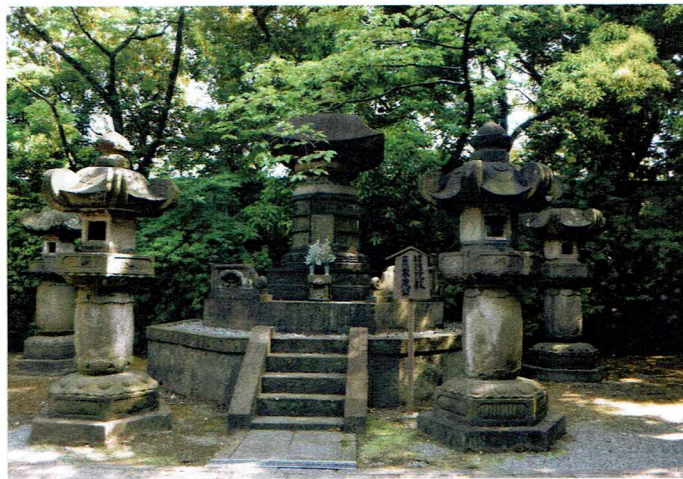
▲ 将軍第十四代家茂