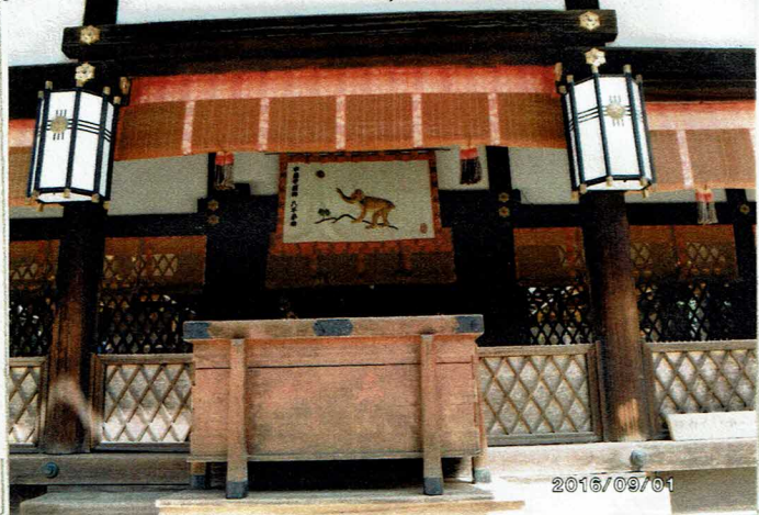
▲本殿（西本殿・東本殿）