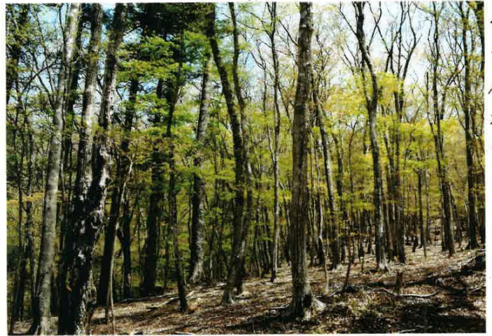
▲ この春の場所です。少しづつ一人独占しました。 冬の原生林です。少しづつ