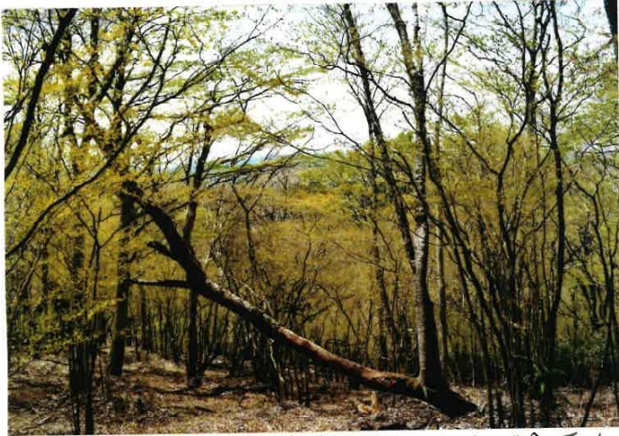
▲ 天狗湖山頂より海坂 7200m まで