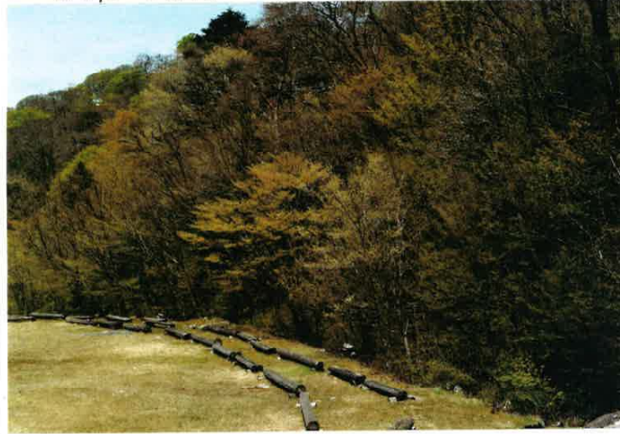
▲ トライククラ 面の木駐車場5月の風は心も優しく

成長が速 く木材とし て、狂いが大 きく腐りや すい、フナや 杉など、皆 伐され、や やこきを 戦後復興 の建設用材 として植林 されました。 現在はフナ が大切に保 持されています。 時代はなり 貯水能力と大 切な水浄化の 役割と効果の 動物産の生 熊系の維持 のための森林 なのです。