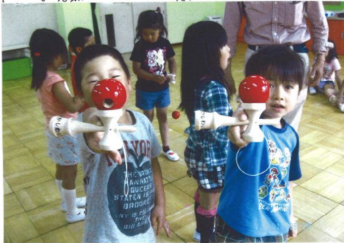
▲ 柏井保育園 来たよ!! 本当かよ。でも不当でした。

左脳 ↔ 右脳 左脳 言語力、数的・論理的、分析的、詳細な場面 右脳 感覚的、直感的、空間的把握、イメージ、創造性 脳は、左脳と右脳で構成されています。左脳は言語力、数的・論理的、分析的、詳細な場面を司ります。右脳は感覚的、直感的、空間的把握、イメージ、創造性を司ります。