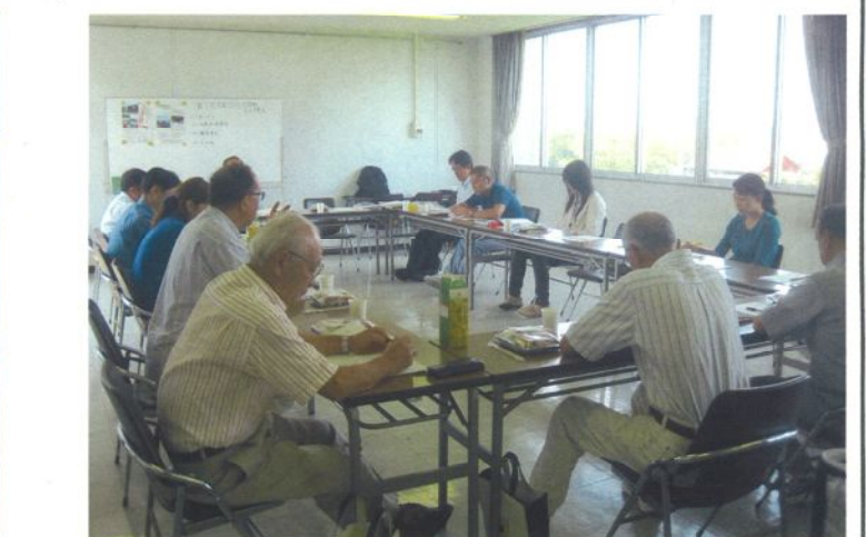
みなさんから多くの意見が出たが、優先順位で即実行する。