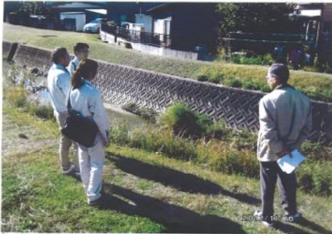
シラタケホシ グサ等について (4) 意見交換

日時 平成二十四年 十一月十六日 集合場所 尾張旭市役所 監視場所 (1) 天田川宮下橋 (上流左岸・右岸) (2) 天神川上流 (文化会館裏側) 家屋からの放流水 について (3) 吉瀬池湿地(旭 五町)の希少植 物シラタケホシ グサ等について (4) 意見交換